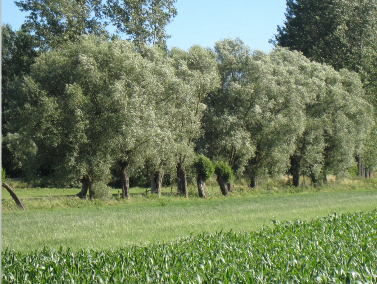
De Helix, Grimminge - 15 juni 2013