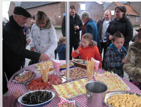
De Helix, Grimminge - 15 juni 2013

Op 1 januari wordt een nieuwjaarsdrink georganiseerd op het Grimmingeplein.