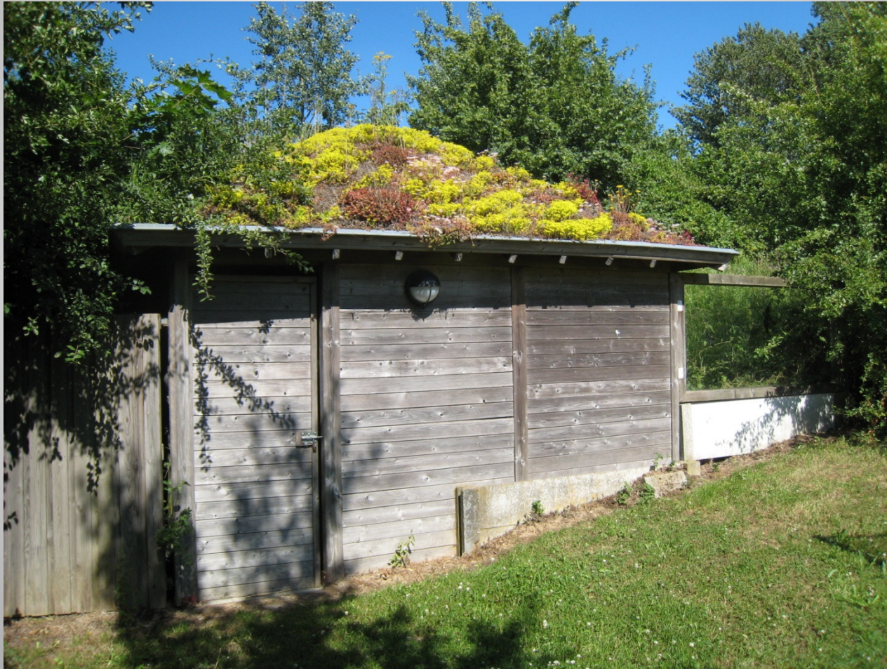
De Helix, Grimminge - 15 juni 2013