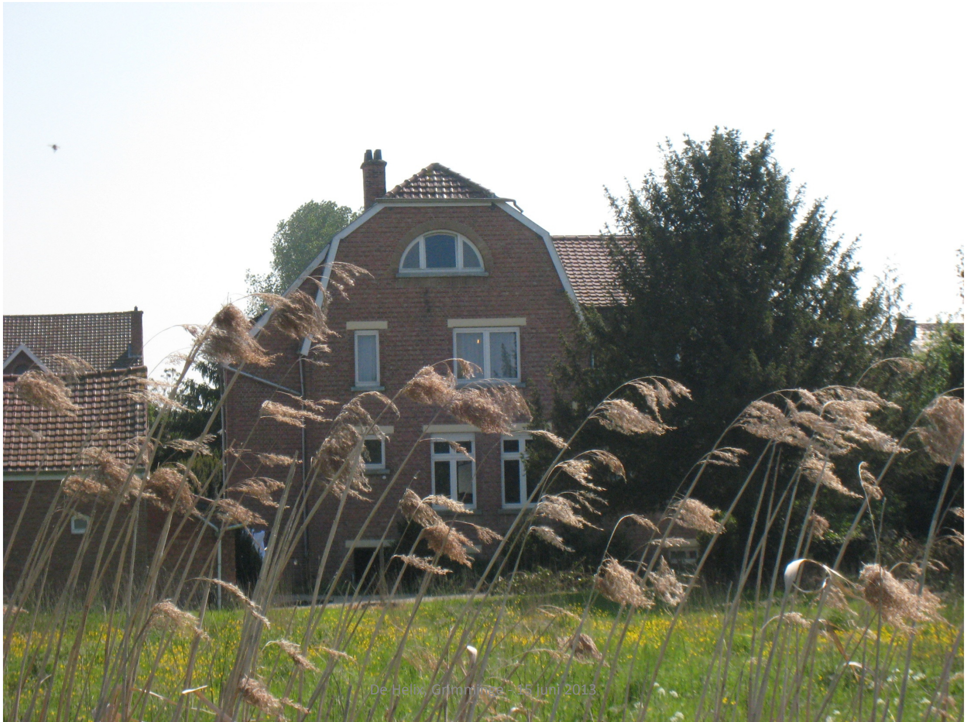
De Helix, Grimbergen - 15 juni 2013