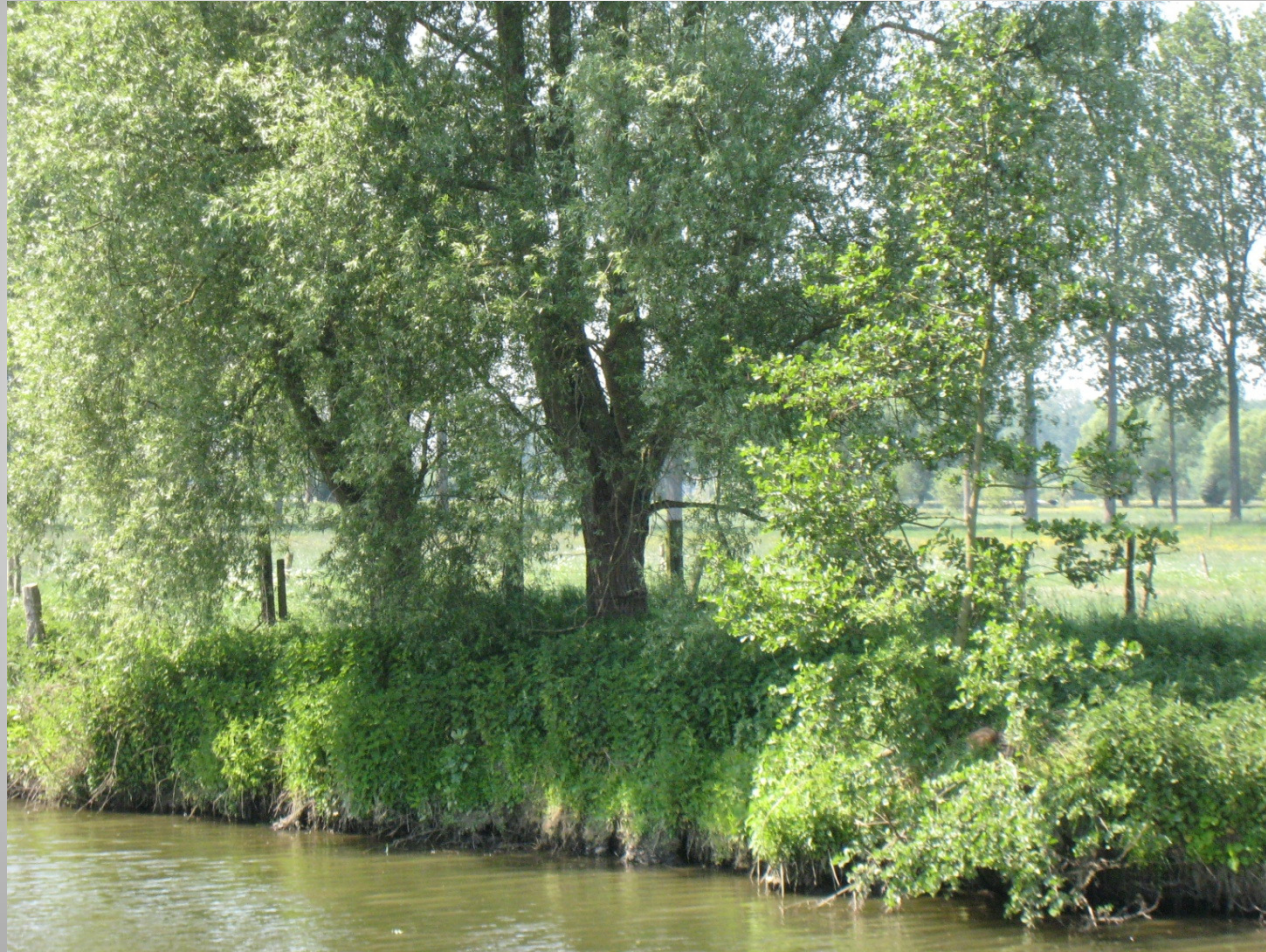
De Helix, Grimminge - 15 juni 2013