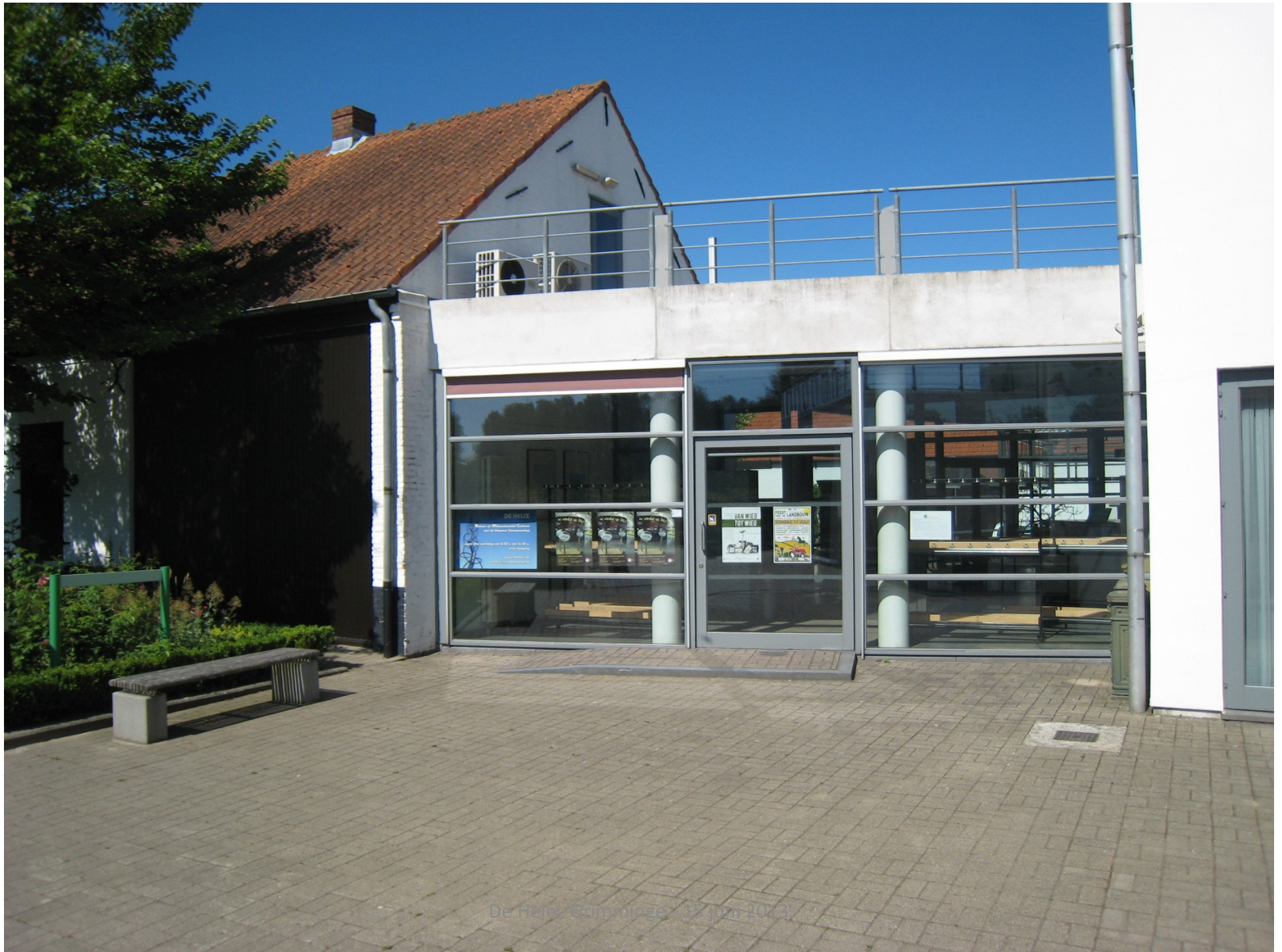
De Hain, Gromminge, 15 juni 2023