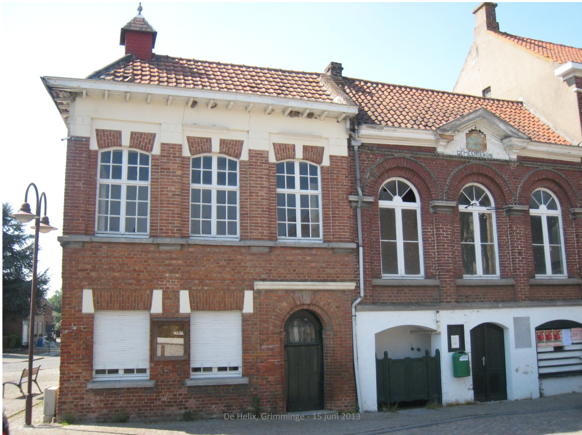
De Helix, Grimminge - 15 juni 2013