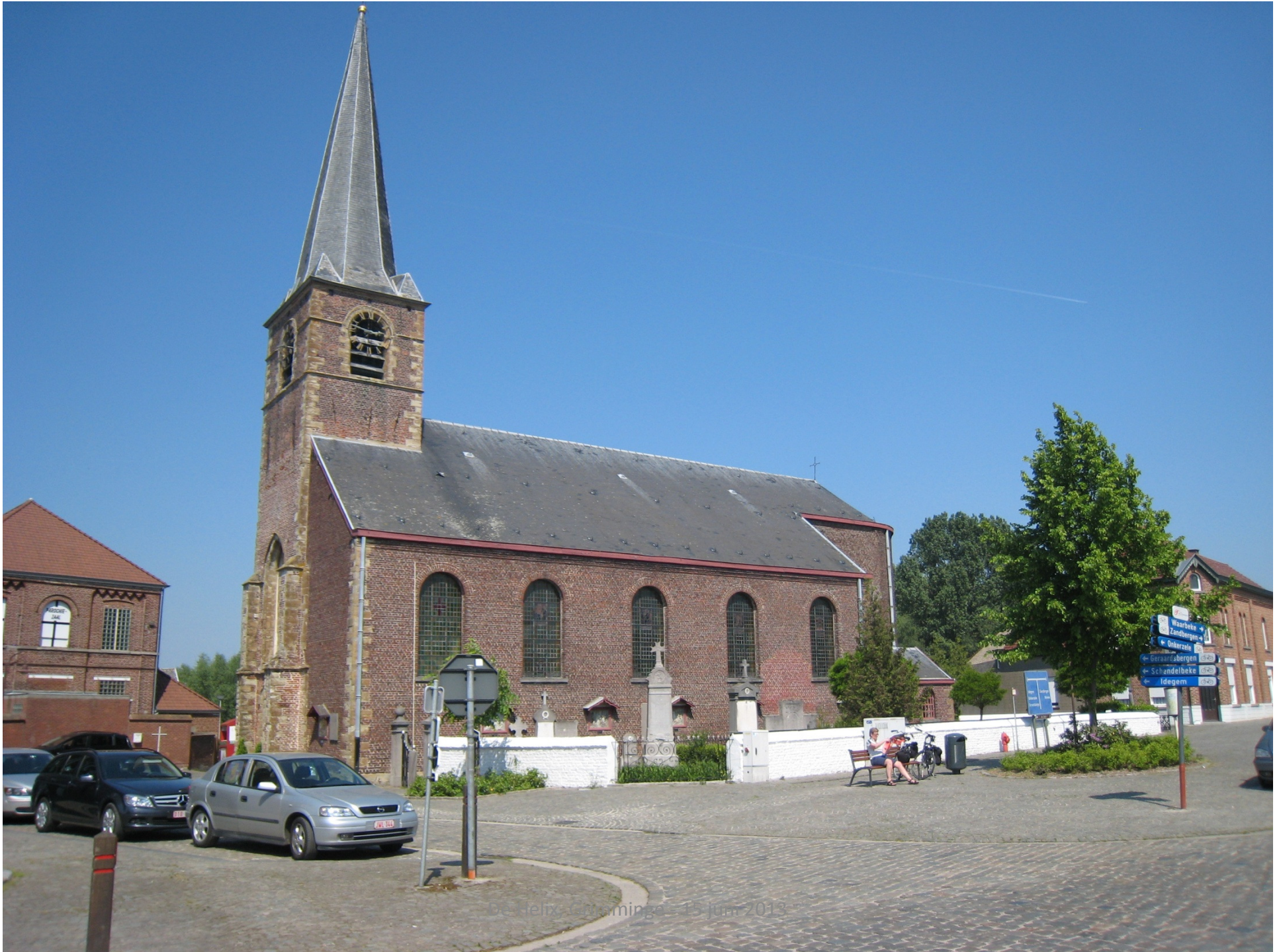
De Helix - Grootmings - 15 juni 2013