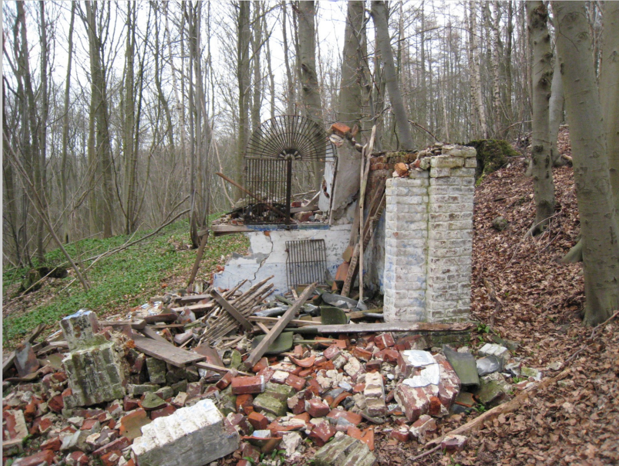
De Helix, Grimminge - 15 juni 2013