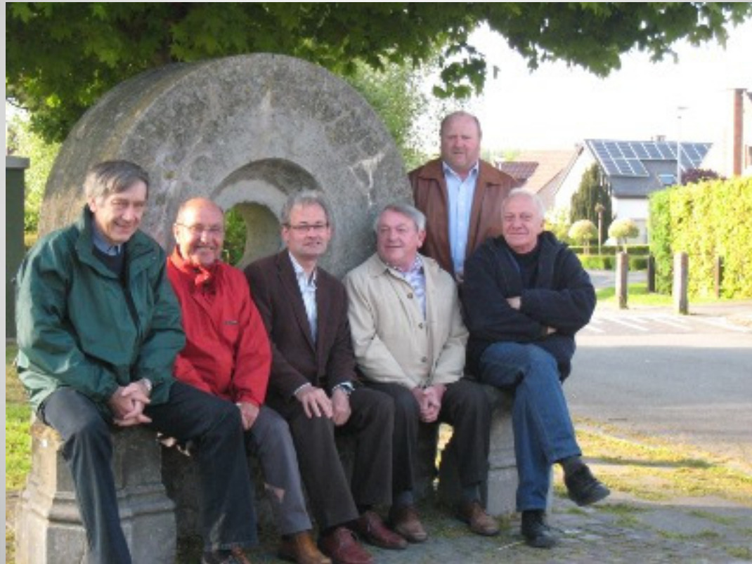
De Helix, Grimminge - 15 juni 2013