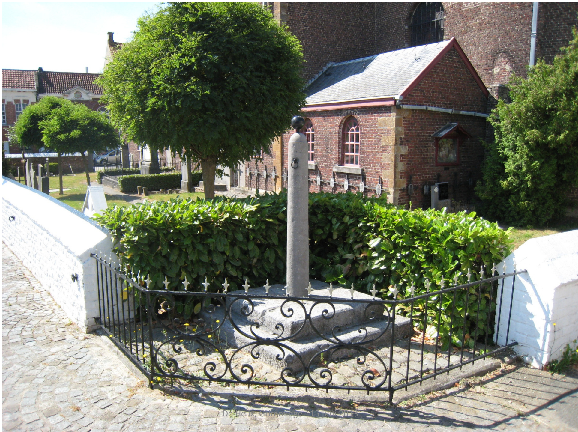
Dé Heint, Grimminge - 15 juni 2013