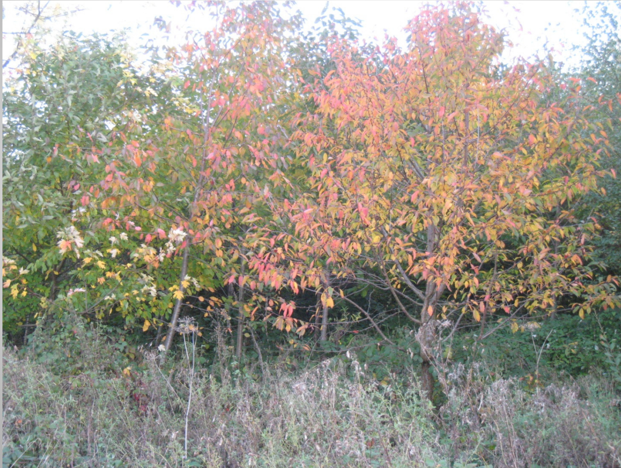
De Helix, Grimminge - 15 juni 2013