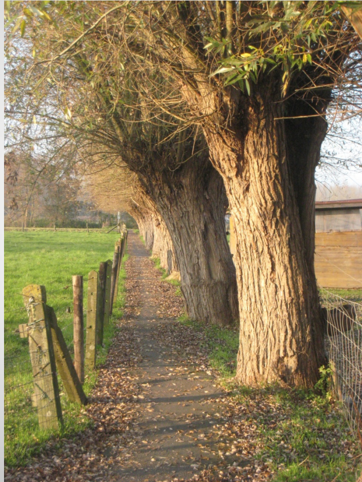
De Helix, Grimminge - 15 juni 2013