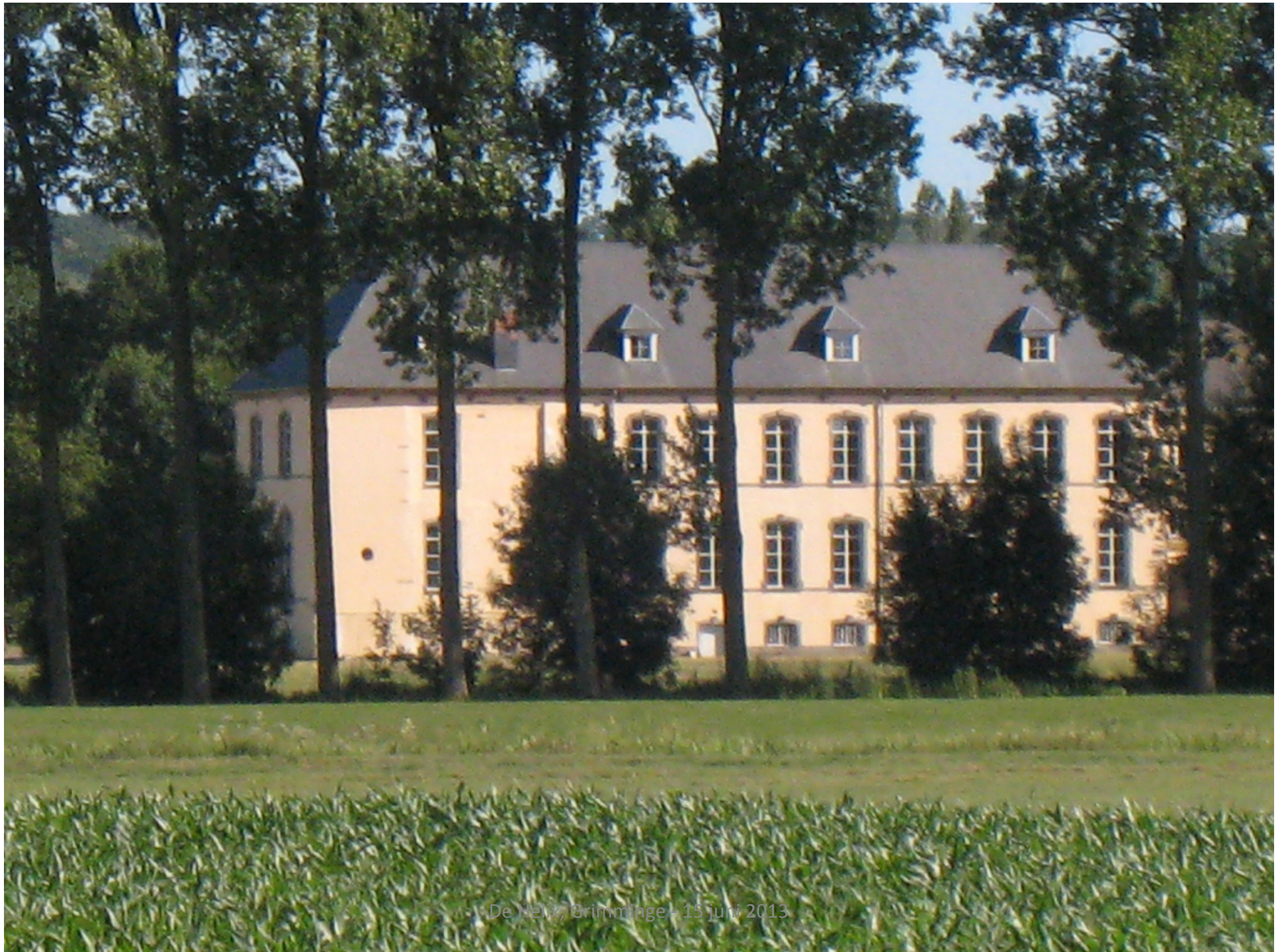
De Helix, Grimminge - 15 juni 2013