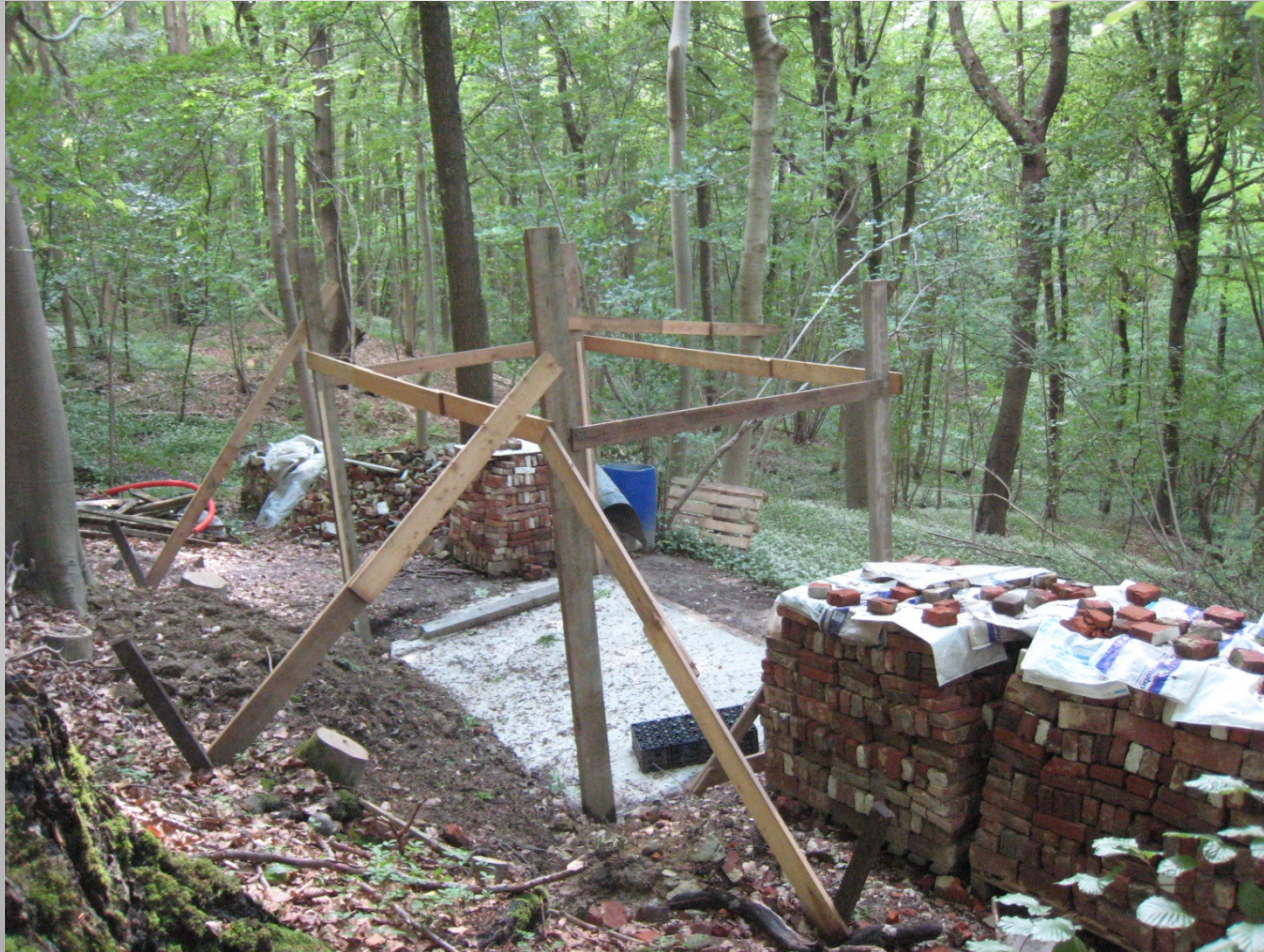
De Helix, Grimminge - 15 juni 2013