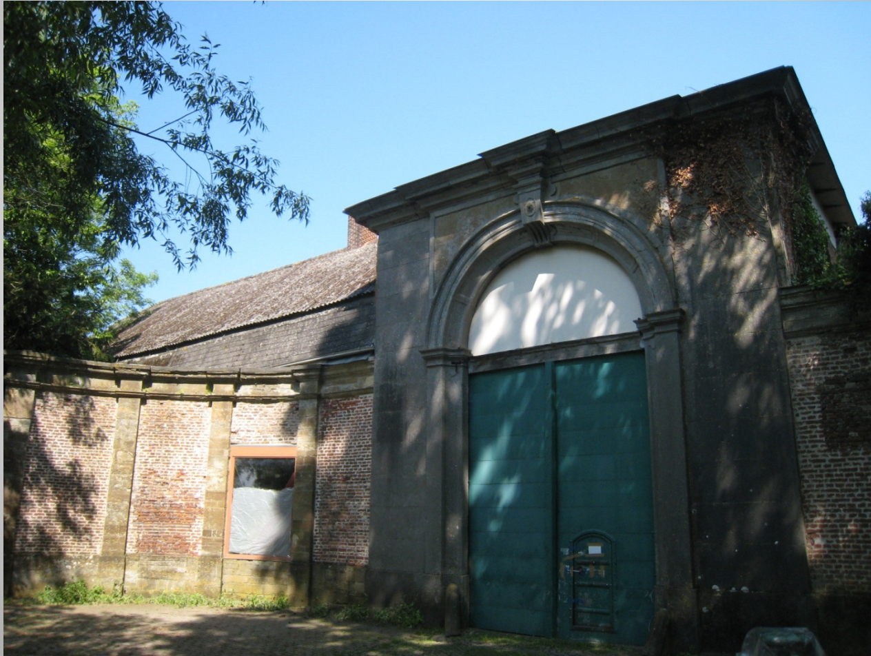
De Helix, Grimminge - 15 juni 2013