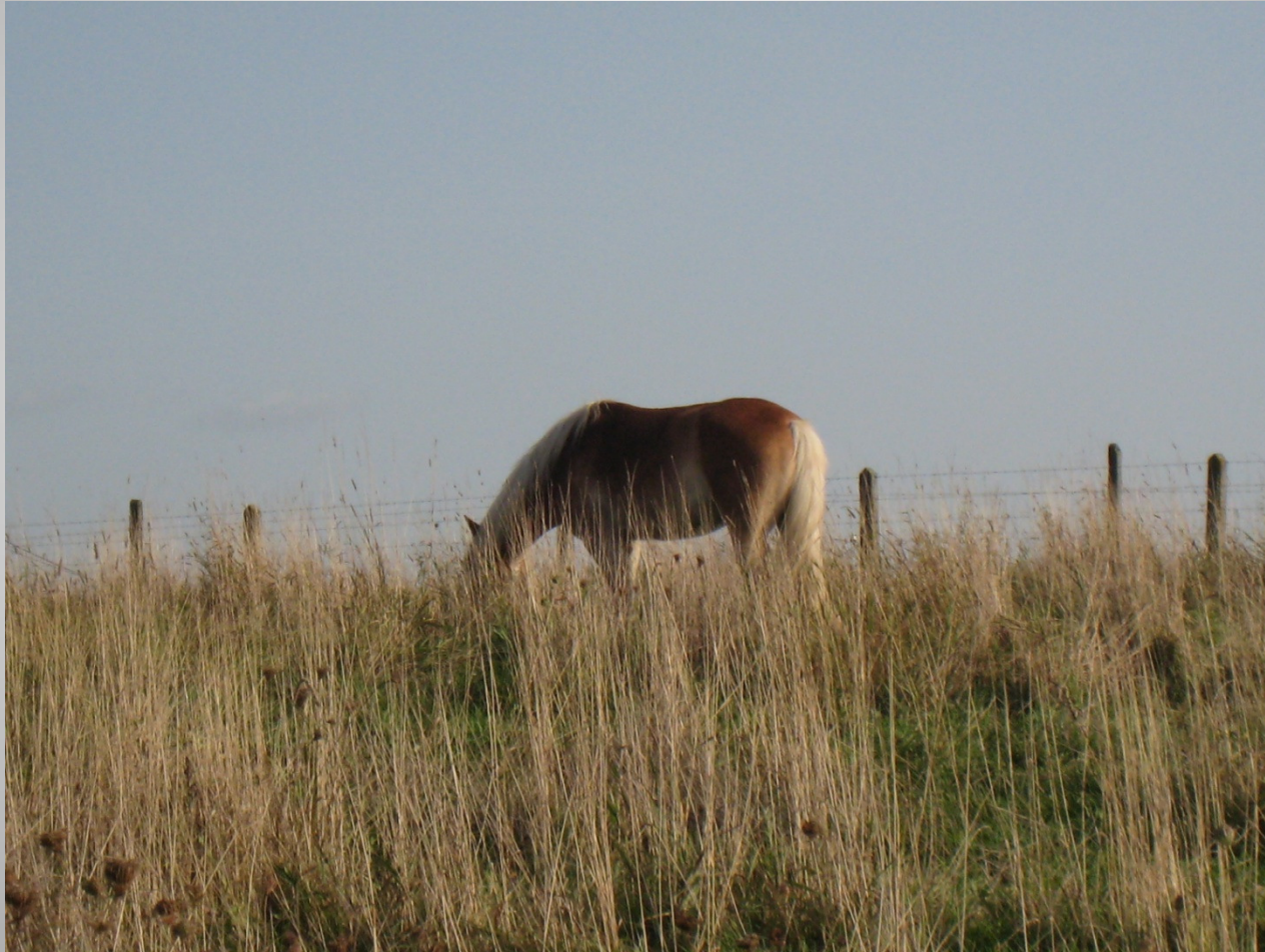
De Helix, Grimminge - 15 juni 2013