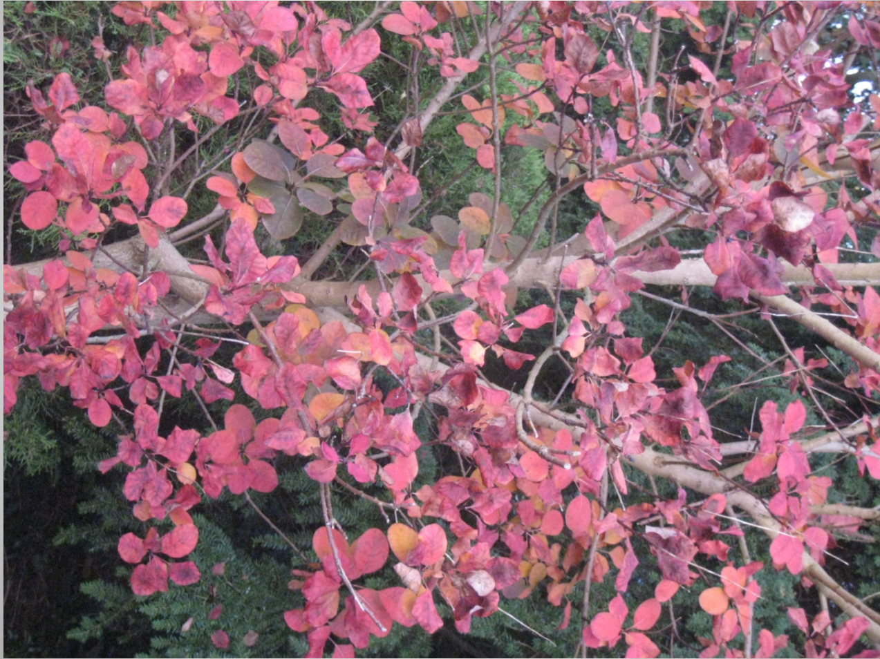
De Helix, Grimminge - 15 juni 2013