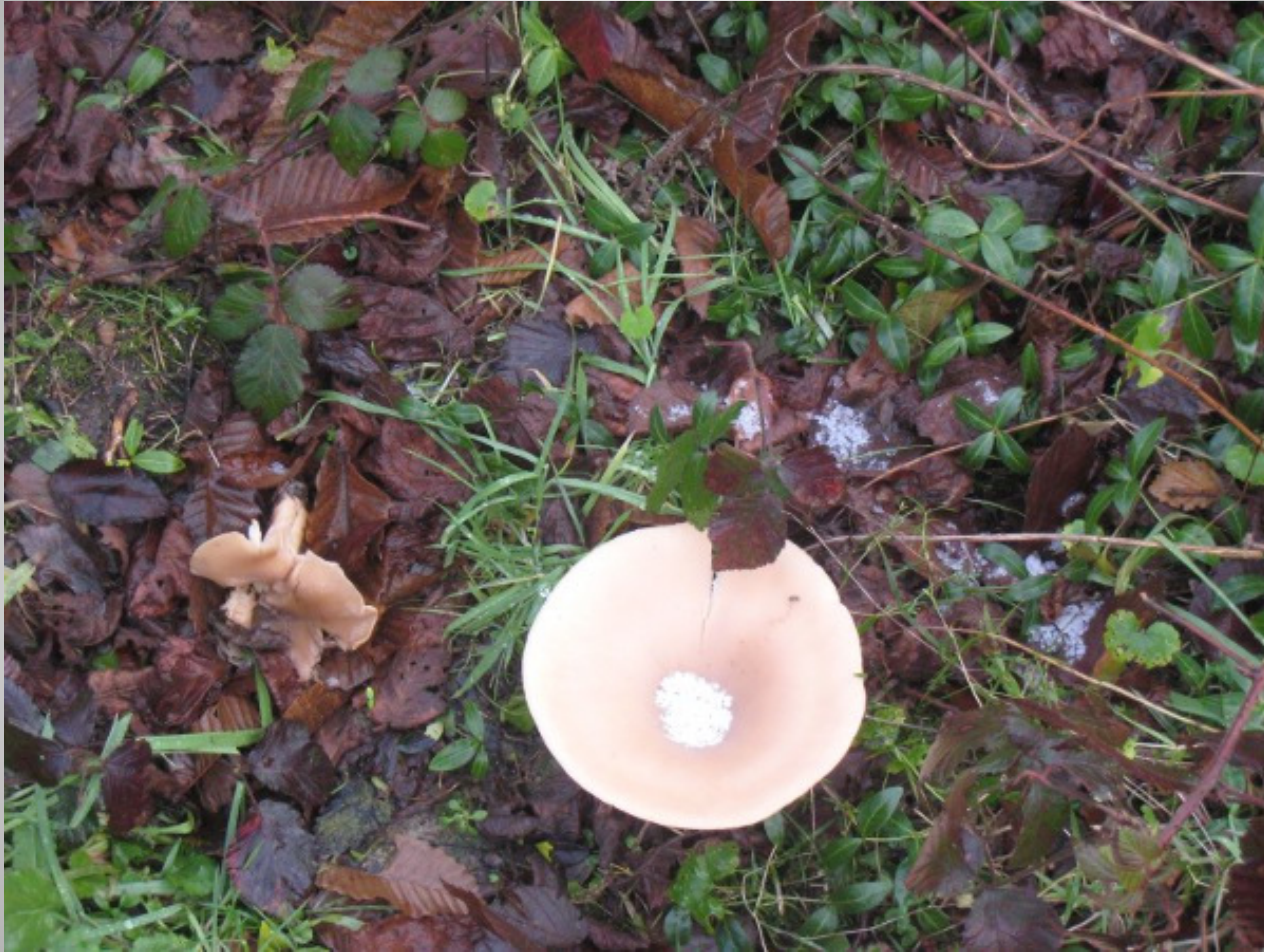
De Helix, Grimminge - 15 juni 2013