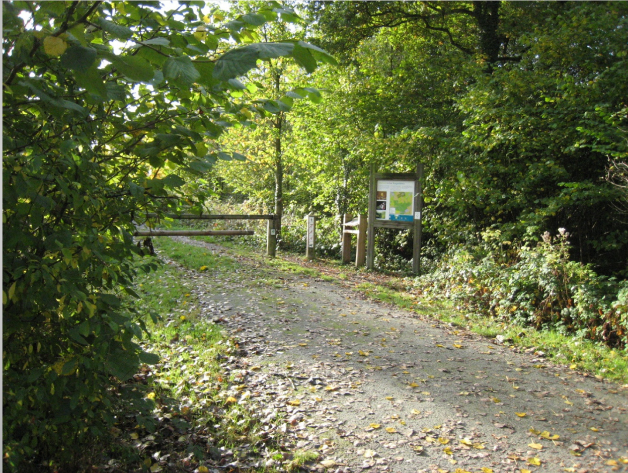
De Helix, Grimminge - 15 juni 2013