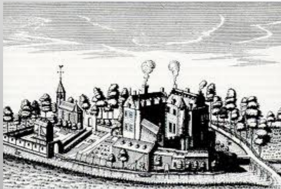
Baronnie van Boelare