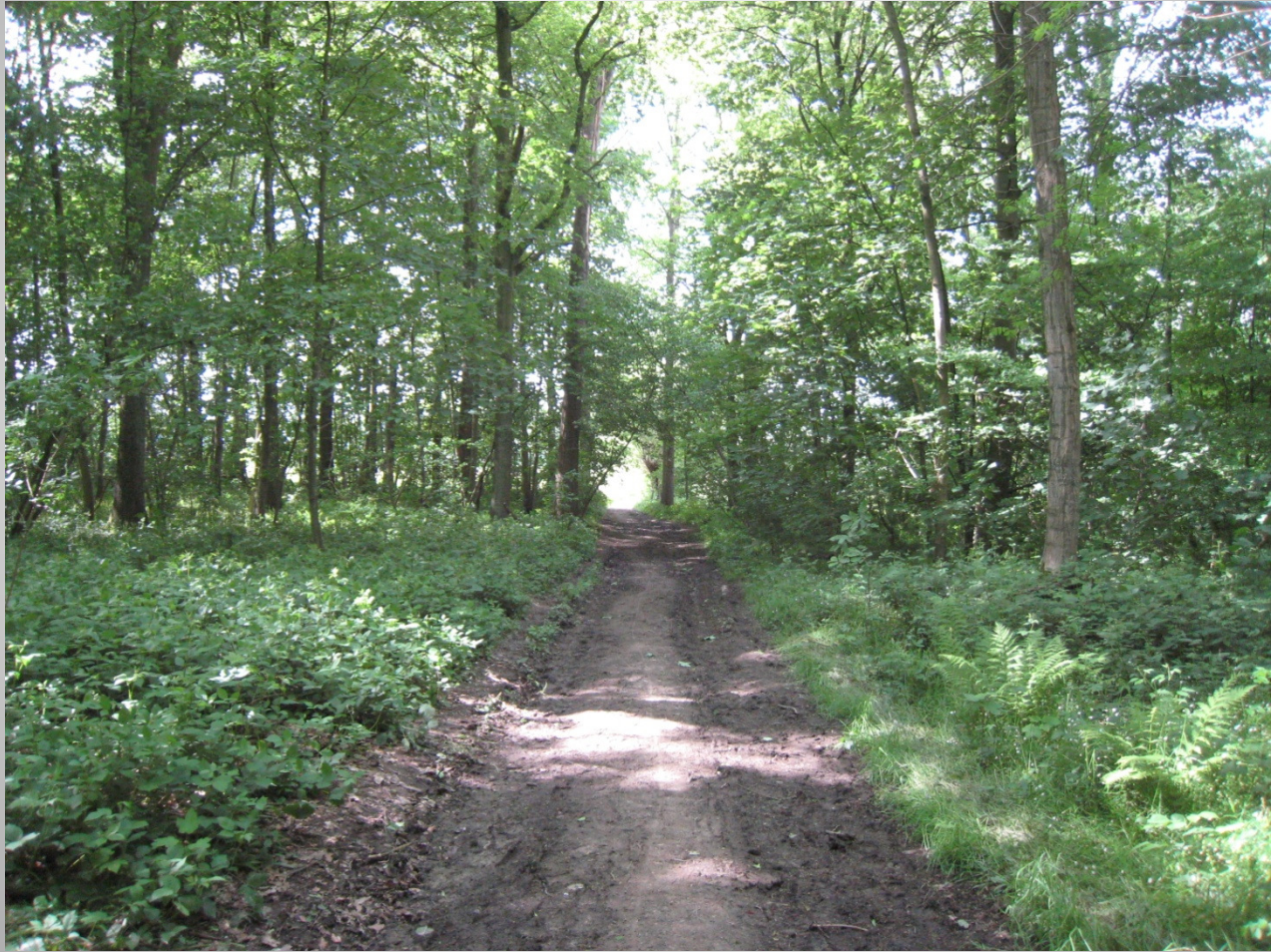
De Helix, Grimminge - 15 juni 2013