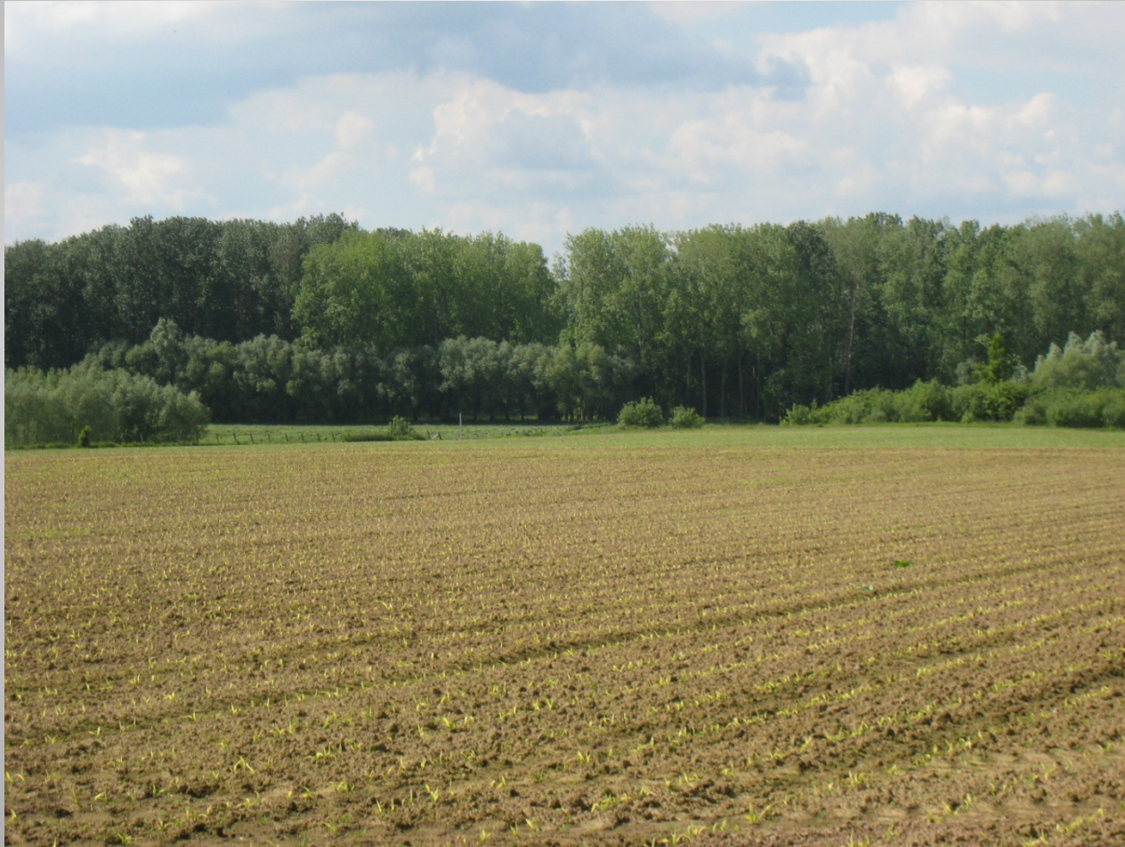
De Helix, Grimminge - 15 juni 2013