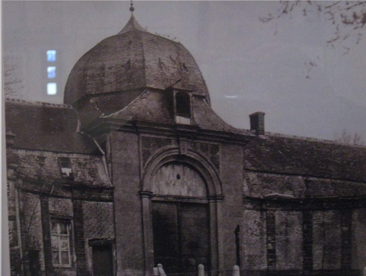
De Helix, Grimminge - 15 juni 2013