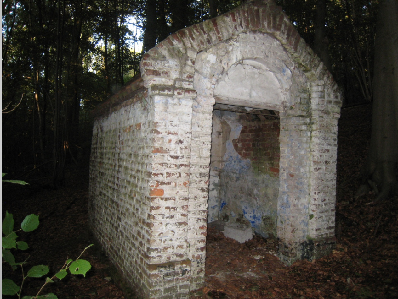
De Helix, Grimminge - 15 juni 2013