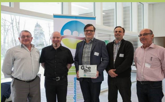
Geraardsbergen won in 2014 de Goe-Bezigs prijs voor gemeenten.