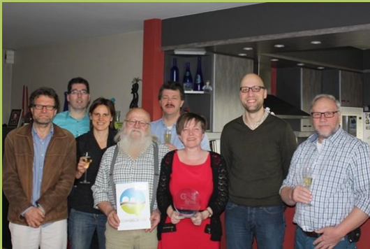
Bewonersplatform Oosteeklo won in 2014 de Goe-Bezigs prijs voor bewonersgroepen.