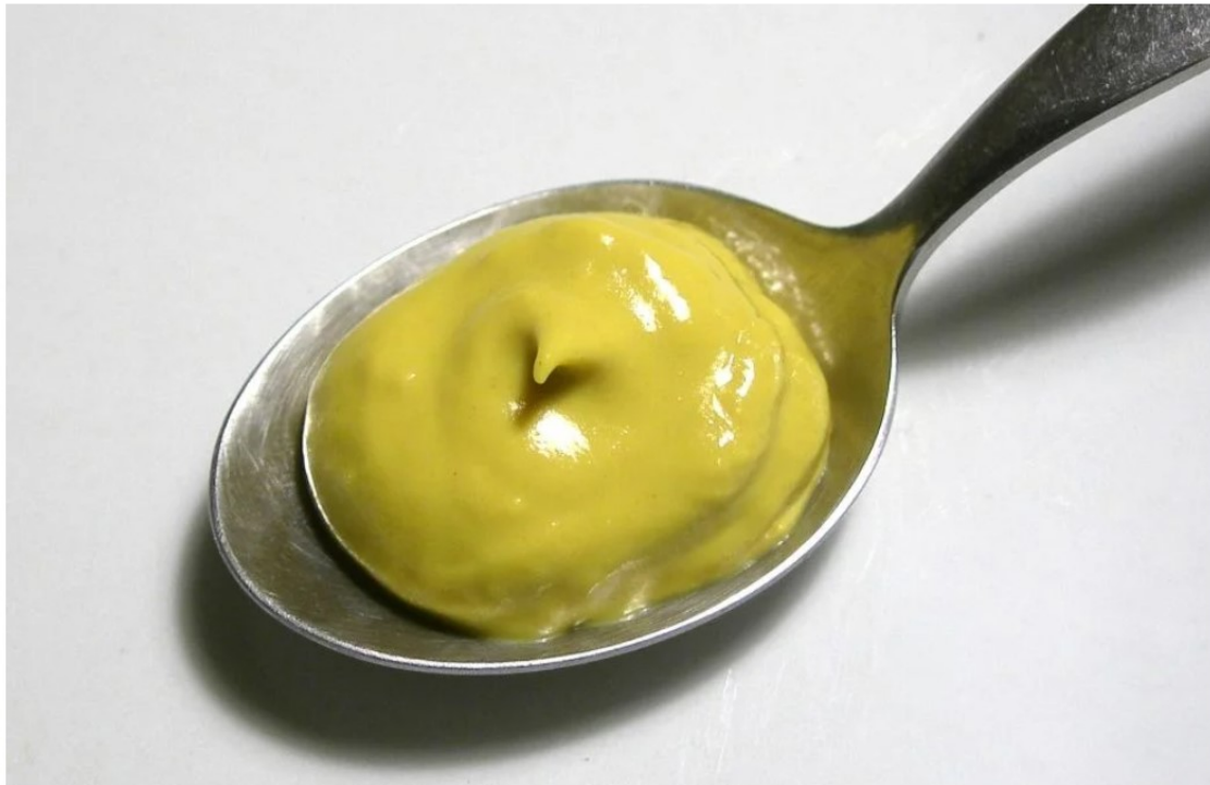
Weten waar Abraham de mosterd haalt