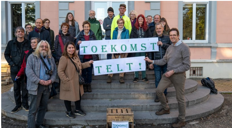
Toekomst Telt want Future Matters!