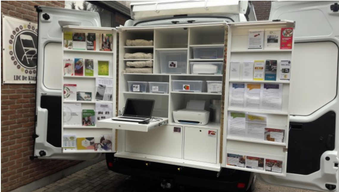
De Klapbus Halen