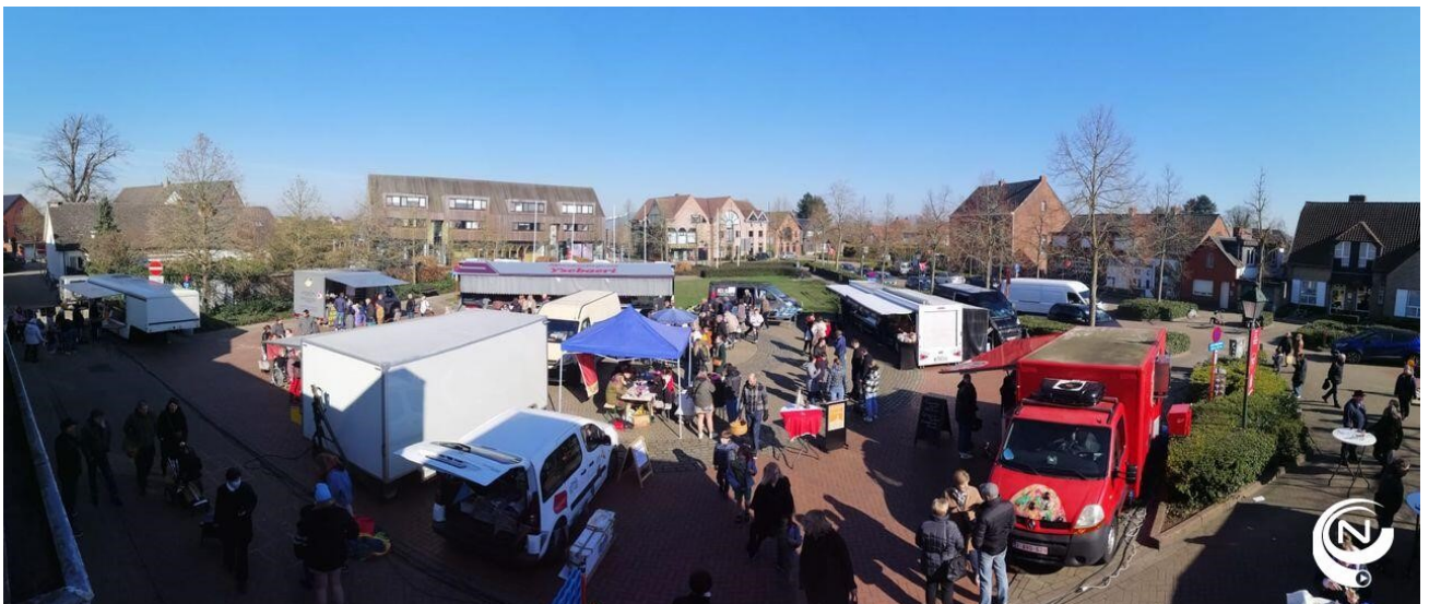
Een initiatief van lokaal bestuur Herentals i.s.m. vrijwilligers: de donderdagmarkt in Morkhoven met marktcafé.