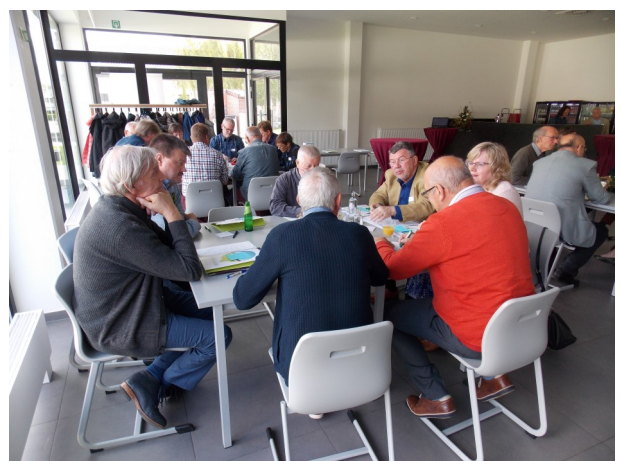
Burgers aan uitwisselingstafels