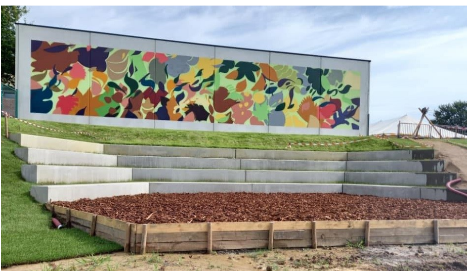
Foto: Amfitheater De Beemdgalm