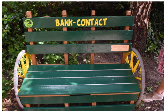
BANK-CONTACT, een realisatie van Dorpsteam Gompel

Naast ontmoeting wordt uiteraard ook op allerlei andere functies ingezet.