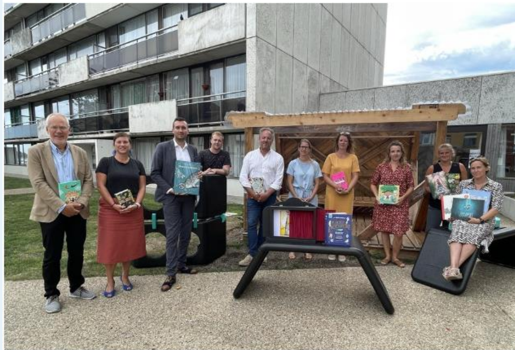
Het actieplan werd dinsdagmiddag voorgesteld en ook het Japans verteltheater werd voorgesteld.

OOSTENDE - In 2019 werd in de Vuurtorenwijk in Oostende een buurtgericht netwerk opgestart die de wensen en de noden van de wijk in kaart moest brengen. Op basis van de bevindingen werd nu een actieplan opgemaakt om leer- en ontwikkelingskansen in de buurt te verankeren, en daar worden ook twee scholen bij betrokken.